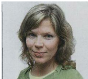
TEKST TUULI KOCH

Sain anonüümkirja ühest Eesti lastekodust. Seal oli kirjas, et kuueaastasel vene poisil, kelle nimi võis olla Saša, käed on päevad läbi kinni seotud. Lapse kinnisidumiseks püüduvad õigustused. Läksime ette teatamata lastekodusse, poisid käed olid tõesti nõõrika kinni seotud. Esimene asi, mida suutsin öelda, oli see, et võtke pahun ta käed lahti. Kasvataja ja direktor kahtlesid, kas see on hea mõte. Poisil seoti käed lahti ja sekundi jooksul tõmbas ta endal küünitaga nõõ veriseks. Mitte kriimud, vaid ikka veri jooksis. Psüühilisest häirest tingitud reaktsioon, mis oma oaduses on saanud mind hiljem ühenäduses. Küsin endalt: mida ma valesti tegin? Käitusin, nagu seadus nõudis, aga kui ma poleks seaduse järgi toimunud, siis ta poleks ennast vigastanud. Õigusest õigluse leidmiseks tuleb see