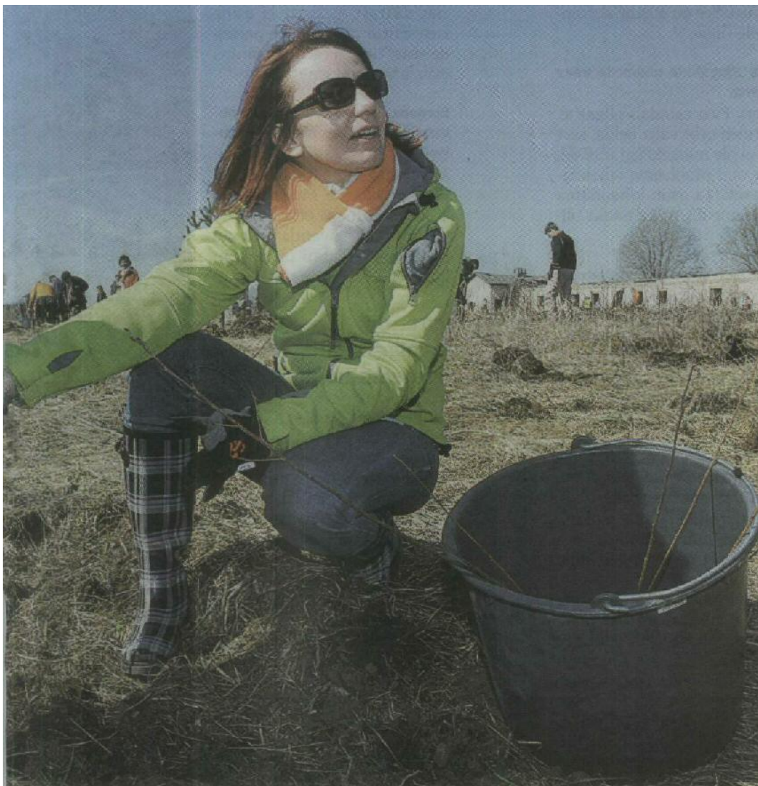
a tegutsevate taastuenergia projektide toetusi ei tohi kärpida, sest see riikuks investorite ootusi ja seaks löö- osaleb ta Balti riikide esimesel ühisel metsaistutuspäeval.