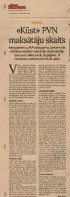
26.10.2017. DB jau rakstīja, ka «kūst» PVN maksātāju skaits, jo, neraugoties uz IKP pieaugumu, pievienotās vērtības nodokļa maksātāju skaits pēdējo divu gadu laikā sarūk.