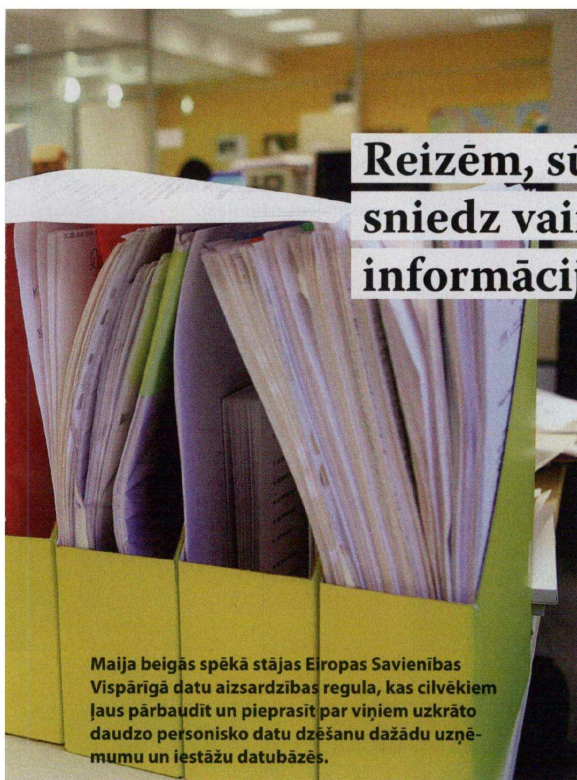
Maija beigās spēkā stājas Eiropas Savienības Vispārīgā datu aizsardzības regula, kas cilvēkiem ļaus pārbaudīt un pieprasīt par viņiem uzkrāto daudzo personisko datu dzēšanu dažādu uzņēmumu un iestāžu datubāzēs.