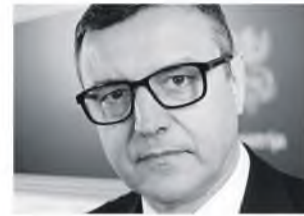
JĀNIS REIRS FINANŠU MINISTRS

13. jūnijā Saeima trešajā lasījumā pieņēma grozījumus Finanšu un kapitāla tirgus komisijas (FKTK) likumā, kā arī Noziedzīgi iegūtu līdzekļu legalizācijas un terorisma